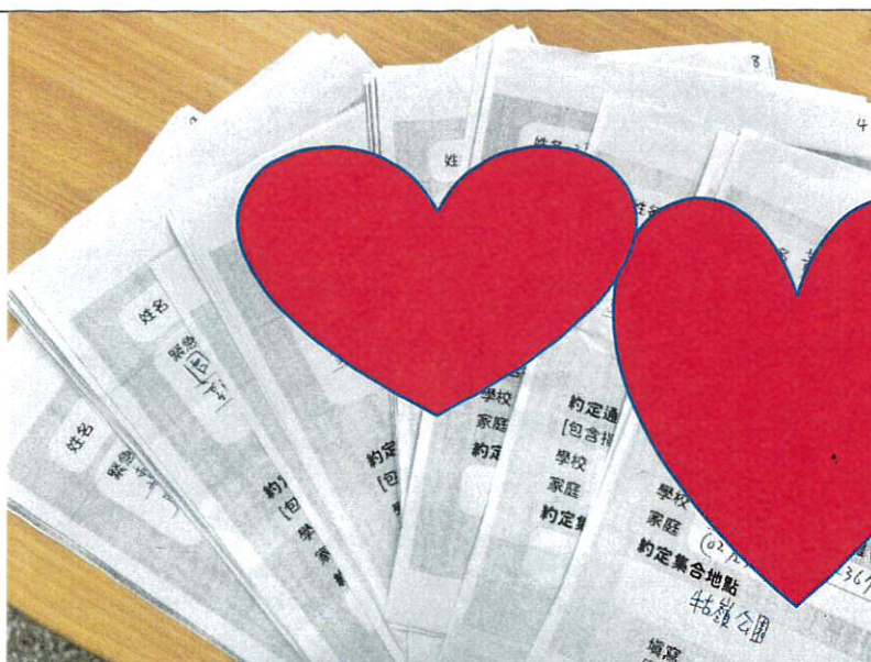
家長填寫之防災卡