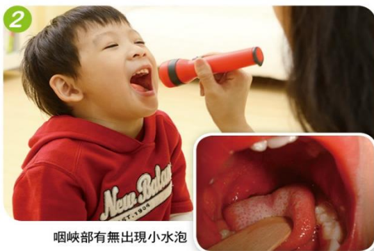
咽峽部有無出現小水泡