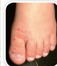
足部有無出現小紅疹